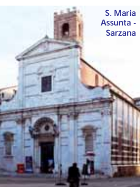
S. Maria Assunta - Sarzana