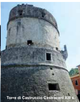
Torre di Castruccio Castracani XIII s.