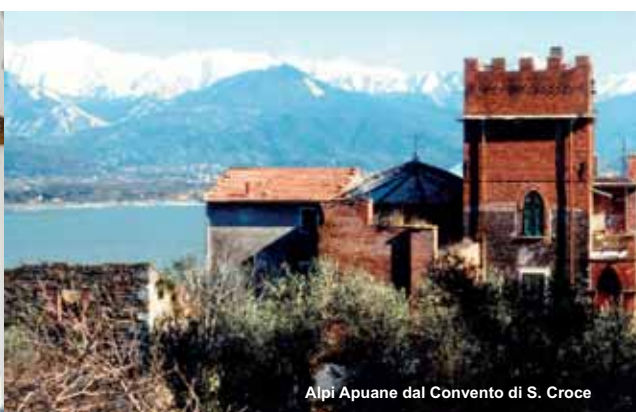
Alpi Apuane dal Convento di S. Croce