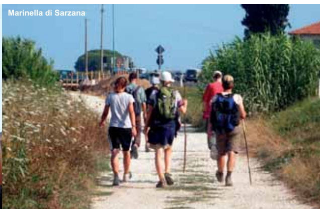
Marinella di Sarzana