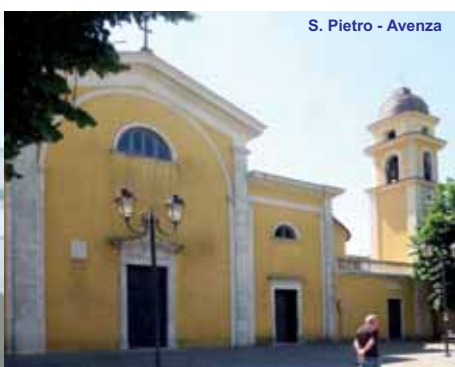
S. Pietro - Avenza