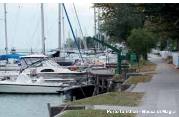
Porto turistico - Bocca di Magra

Pietrasanta-Sala avec forteresse octogonale lombarde (possible étape de Nikulas en 1154 en aval de Capriglia), est reliée au bourg fondé en 1255 par le Milanais Guiscard de Pietrasanta. Avec son port de Motrone (transport du fer, de l'argent et du marbre de Carrare), elle est convoitée par Pise et Lucques; le seigneur de celle-ci, Castruccio Castracani, fortifie le bourg actuel au XIV es . avec la «rocca Arrighina». Depuis le pape Léon X (1513) entre dans le Grand-Duché de Toscane comme «cité noble» jusqu'en 1870. ☞ ville paradis des sculpteurs et le Dôme St-Martin (XIII-XIV es .) et ☞ ☞ les églises des Saints Giovanni et Felicità, joyau d'art roman (XIII-XV es .).