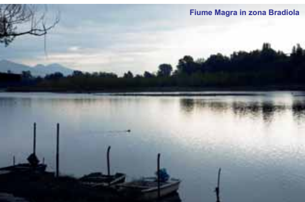
Fiume Magra in zona Bradiola

☞ ☞ A paradise for sculptors, St. Martin cathedral (13 th -14 th c.) and church of Saints Giovanni and Felicità (13 th -15 th c.), jewel of Romanesque art.