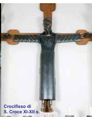
Crocifisso di S. Croce XI-XII s.