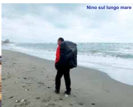
Nino sul lungo mare