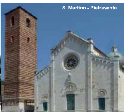
S. Martino - Pietrasanta